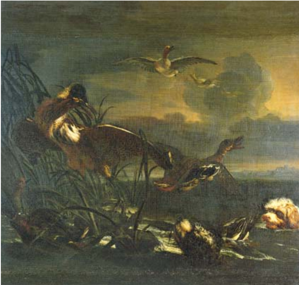
Joannes Hermans detto Monsù Aurora Anatre assalite da due cani, 1657*