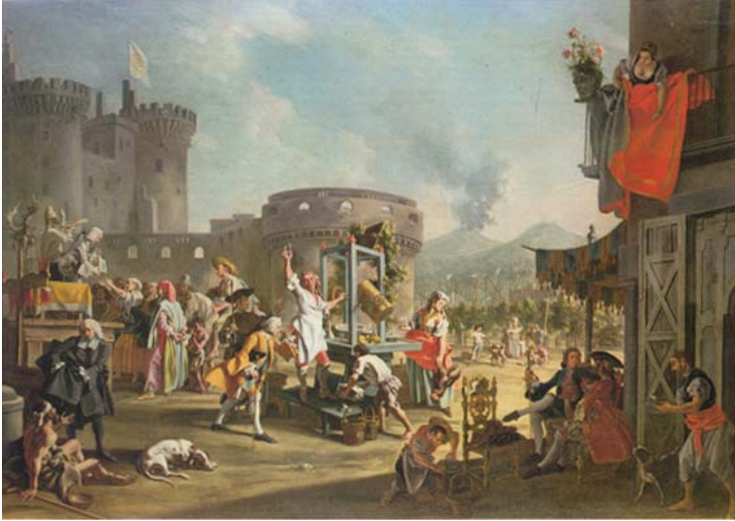
Filippo Falciatore Scena di vita popolare al Largo di Castello, 1760 ca.**