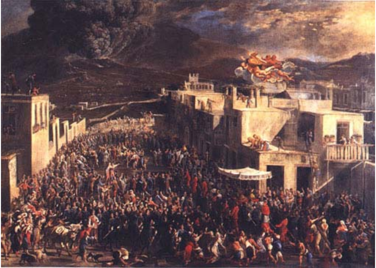
Domenico Gargiulo detto Micco Spadaro (Napoli 1609/10-1675) Eruzione del Vesuvio , olio su tela, cm 126 x 177, tra il 1656 e il 1660, siglato «DG». Capua, collezione privata.