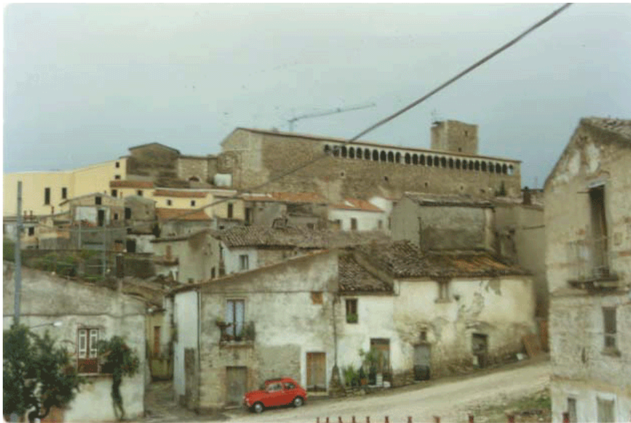
una cinquecento rossa a Bisaccia