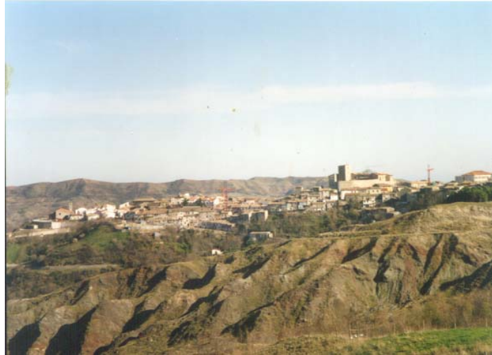
« Una desolata altura bizantina e un grumo di case in bilico su un costone di argilla e cianuro » f.a.

Bisaccia si trova in provincia di Avellino: paese della cicuta e d'altro: di non vita, d'emigrazione, d'interdizioni, di sgomento, di disperazione, di corteggiamento della morte... e dei "versi a oltranza" di Franco Arminio.